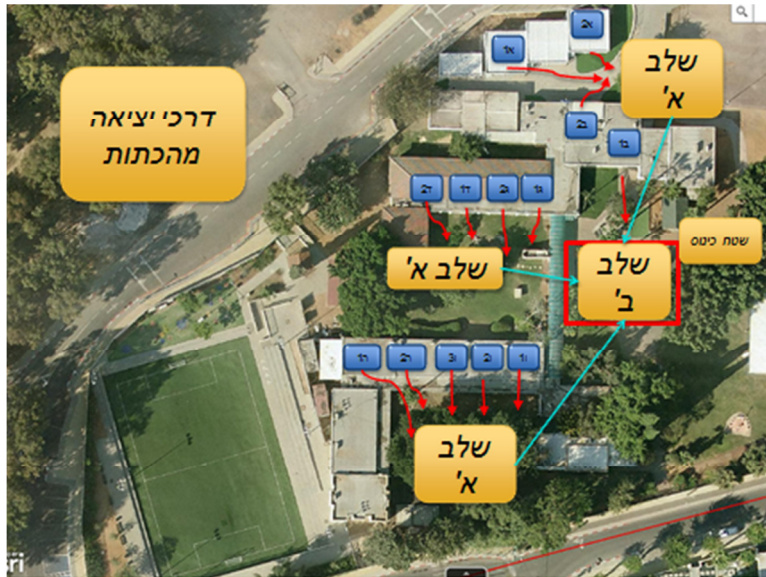
10.6. תרשים סכמתי פינוי גני ילדים ברעא"ד