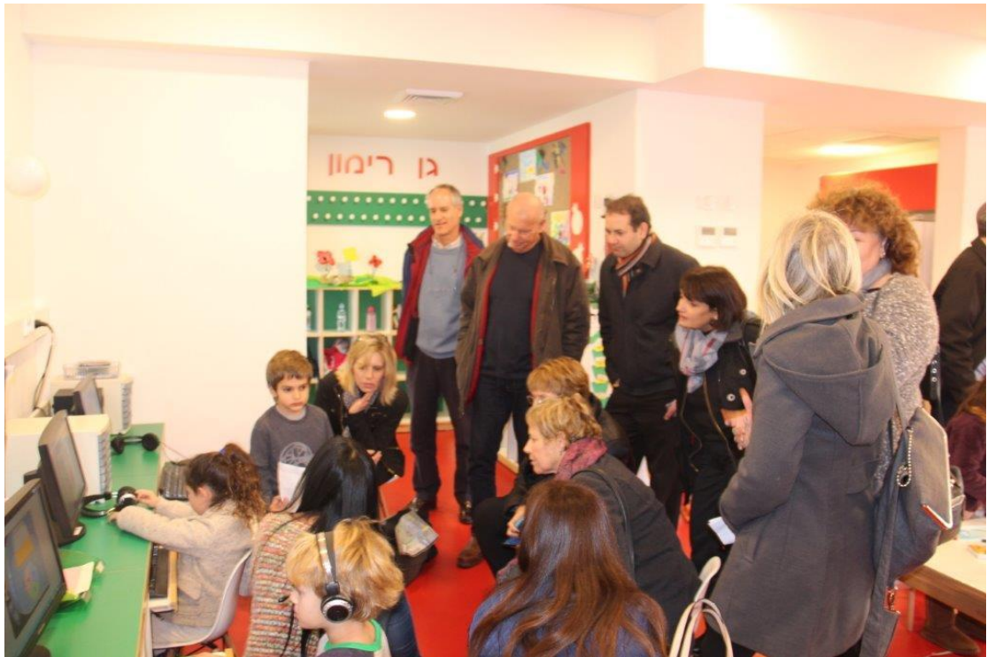
תודה לצוות האשכול ומרכז העצמה, תודה לגננות ולצוות גני הילדים וכמובן לילדים המתוקים.