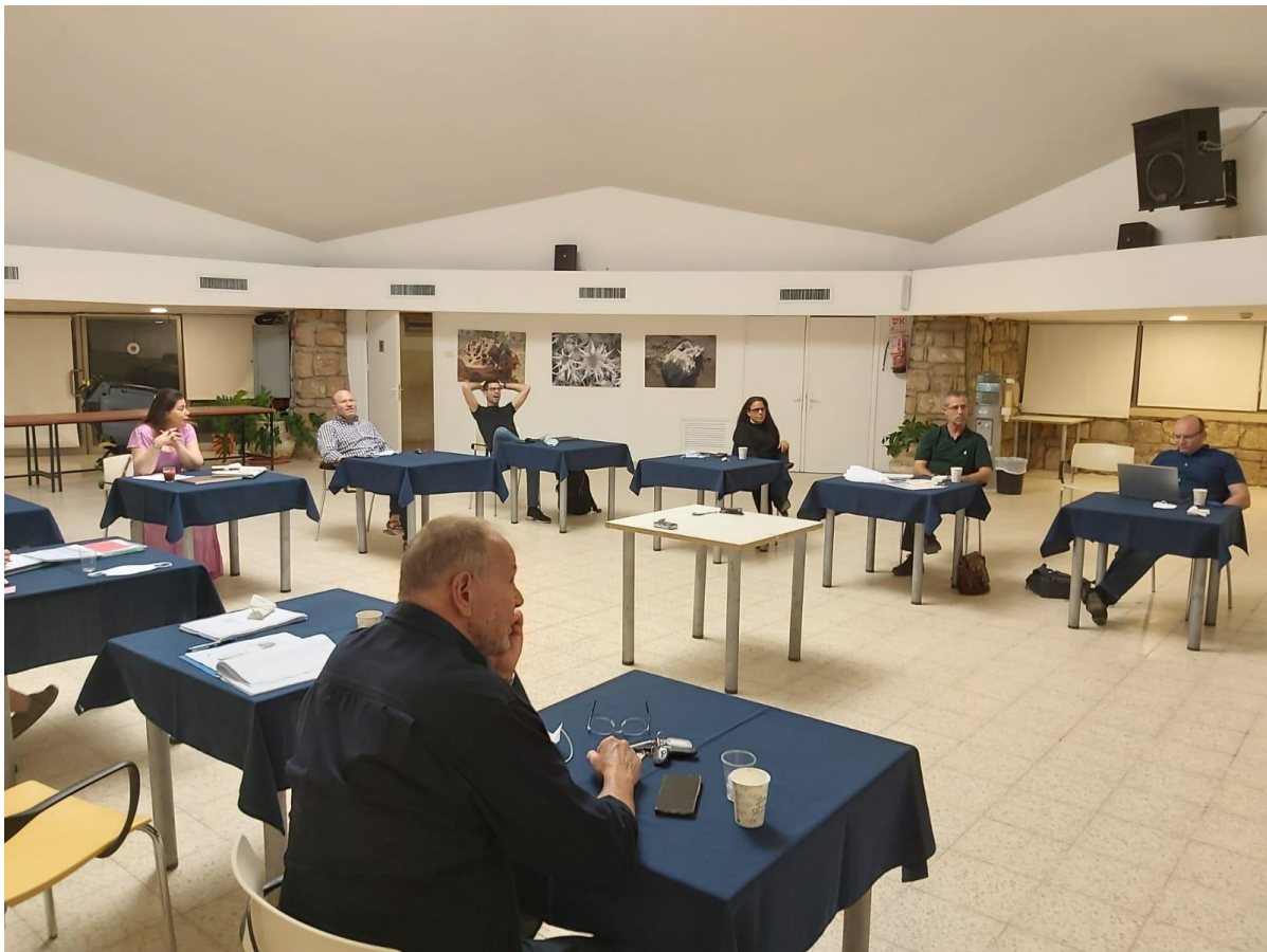
ישיבת מליאת המועצה בצל תקנות הקורונה

בנוסף, עובדי המחלקה סייעו לאבות הבית במתחמים השונים בביצוע העבודות לשיפוץ וחידוש המתחמים.