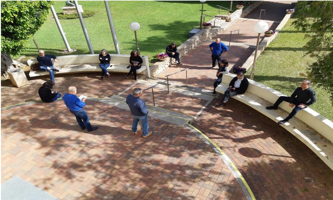
ישיבת ראשי מחלקות בתקופת הקורונה