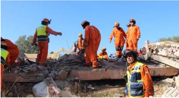
יחידת חילוץ והצלה כפר שמריהו רשפון בתרגיל היקפי באור יהודה, דצמבר 2014