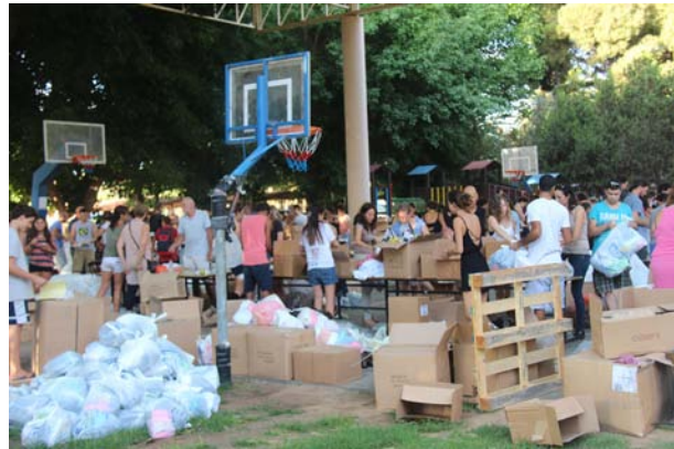
"למען הכלל" - אורזים חבילות ללוחמי "צוק איתן", יולי 2014

חיי הקהילה יטופחו ויפותחו, תתקיים סולידריות חברתית בתוך הקהילה ונושיט יד לסיוע לקהילות אחרות.