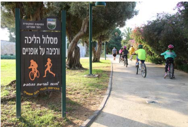
תלמידי בית הספר רוכבים בשבילי היישוב, יום הבטיחות הלאומי, דצמבר 2014